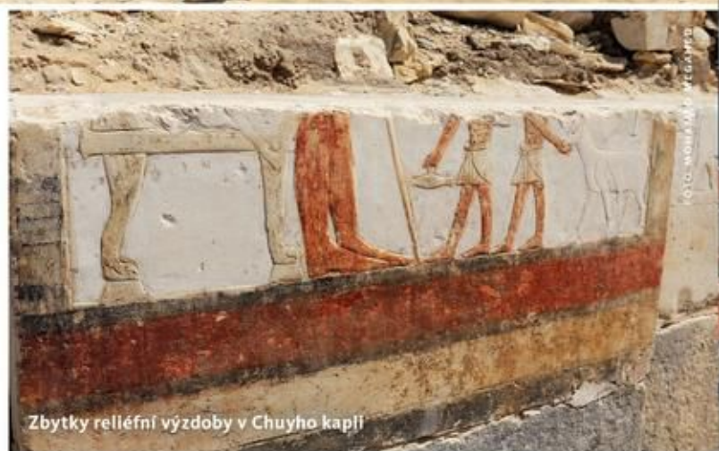
Zbytky reliéfní výzdoby v Chuyho kapli

H. V.: Poprvé jsme se setkali při práci na vykopávkách v Abúsíru